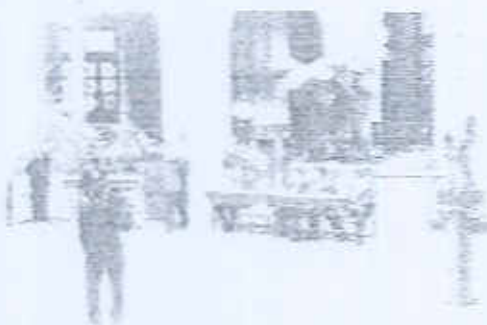
Actividad cambio de la Rosa Monseñor Arandi (Villa Nueva)